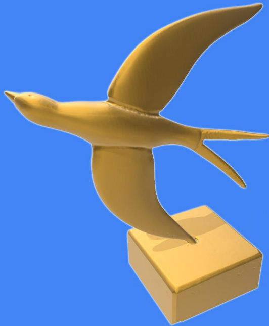
Premio Rondinella d'oro 2022